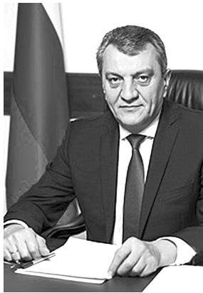
СЕРГЕЙ МЕНЯЙЛО, ГЛАВА РСО-АЛАНИЯ

Друзья! Пусть молитвы, произнесенные с чистым сердцем и добрыми помыслами, будут услышаны! С праздником вас!