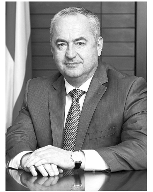
ТАЙМУРАЗ ТУСКАЕВ, ПРЕДСЕДАТЕЛЬ ПАРЛАМЕНТА РСО-АЛАНИЯ

Фарн æмæ амондæй хайджын ут, Ирыстоны адæм! Чи уын ис хистæрæй, кæстæрæй, уыдон уæхи фæндиаг уæнт. Арфæгонд ут æмæ бæрæгбонь хорзæх уæ уæд!