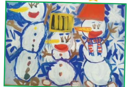
Галазов Артур, 7 лет