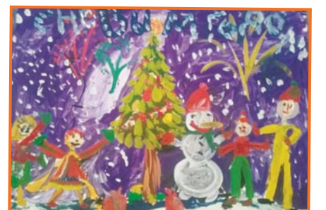
Засеева Ляя, 6 лет