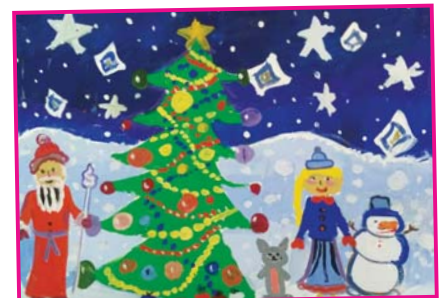
Урусова Лаура, 8 лет