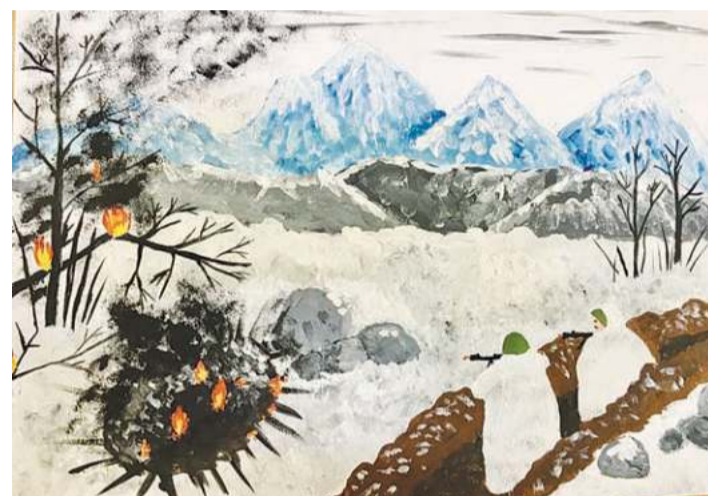
Кавказ», макет «Самолет У-2», по итогам конкурса заслуженно получил 2 – I и 2 – II места.