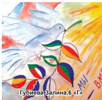
Губиева Залина, 6 «Г»